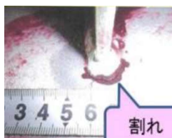
溶接線際の応力集中による割れ