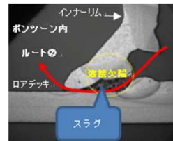
溶接欠陥に起因する割れ