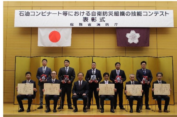
受賞組織との記念撮影