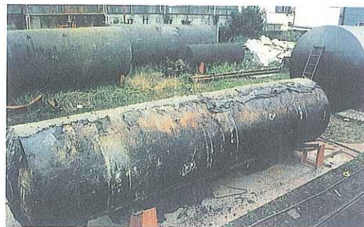
写真6 漏えい事故を起こした専用タンクを専門業者の工場において、見分したところタンク底部に2箇所の孔があいており、底部全体の腐食が進んでいた。