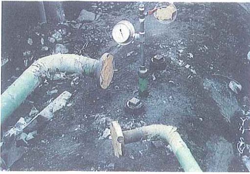
写真3 漏えい事故を起こした専用タンクに圧力ゲージを取り付け、タンク本体に加圧試験を実施している状況