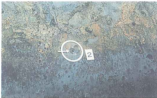
写真8 漏えい事故を起こした専用タンクの②は孔が直径約6ミリであった。また、写真7同様の状態であった。