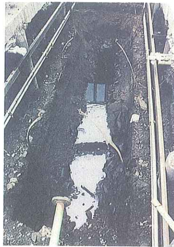
写真4 漏えい事故を起こした専用タンクを掘り揚げた時、専用タンクの基礎部分には、黒い油等が相当滞留している。

ケ 専用タンクを搬送した工場に関係者とともに出向し、仔細に見分したところ専用タンク底部の2箇所直径5mmと6mmの孔が開いているのが確認された。専用タンクの底部全体的が腐食している状態であり、中には孔がいつまでも不思議でない箇所も見受けられた。(写真6、7、8参照)