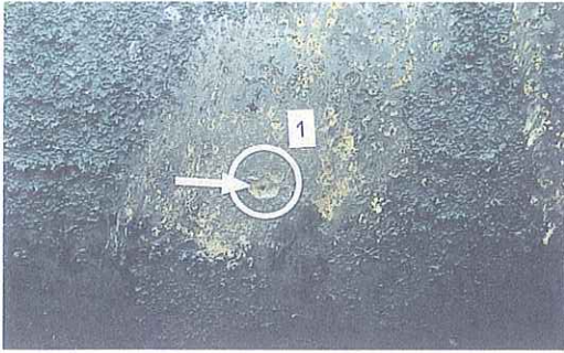
写真7 漏えい事故を起こした専用タンクの①は孔が直径約5ミリであった。また、孔があいている部分以外でも全面に錆が発生しており、中には孔があいてもおかしくないような箇所もあった。錆は、明らかに外側から発生している状況を示している。