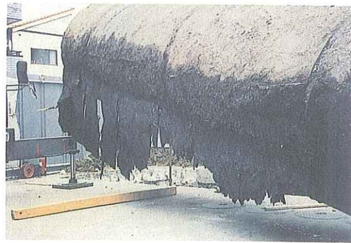
写真5 漏えい事故を起こした専用タンクをクレーン車により地上に掘り揚げたところ、タンクの防水措置のアスファルトの塗覆装が剥がれて垂れ下がっており、塗覆装も均一でないが見分される。