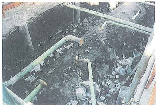
写真2 漏えい事故を起こした専用タンクの地盤面を掘削し、砂等を取り除いた状況

オ 専用タンクの加圧試験を実施するには、地盤面を一部掘削する必要があることから、変更許可申請及び仮使用承認申請等の必要な手続きをさせ、安全対策に万全を期して工事を実施させた。また、漏えい検査管から採取した油状物質の成分を分析させたところ、ガソリンであるとの報告を受け、成分分析結果の写しを受理した。(写真2参照)