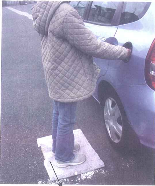
特殊炭素繊維をコーティングした不織布をマットとして敷いた。