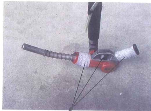
特殊炭素繊維をコーティングした不織布