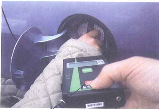
静電気測定器 測定状況