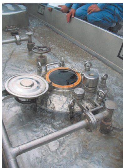
写真2 水を用いたオーバーフロー事故の再現