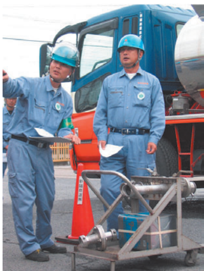
写真1 乗務員に間違った指示を出す立会者役

これらの取組みを実施した2008年においては、荷主様より事故件数減少に対する評価を頂くことができ、数字の上でもその結果が現れた（図1）。これらは、弊社乗務員が一丸となって