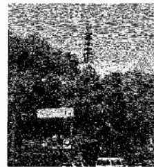
屋上の赤い塔が目印です！