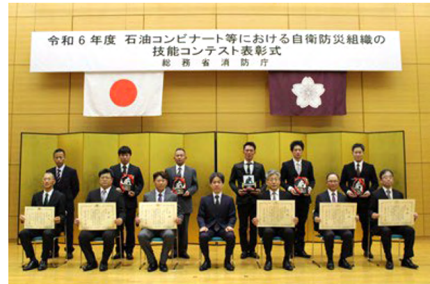
受賞組織との記念撮影