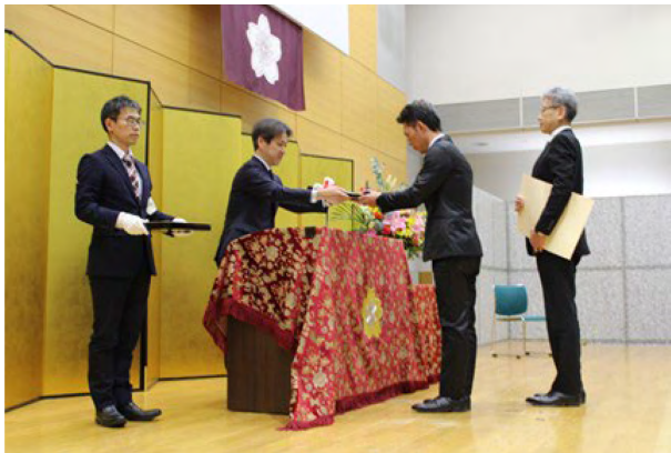
最優秀賞 四日市臨海地区特別防災区域 共同防災組織（昭四石隊）