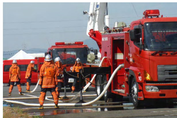
コンテスト競技中の風景